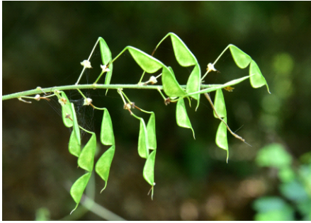
Fig. 2. 도둑놈의갈고리 열매