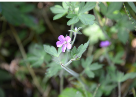
Fig. 8. 쥐손이풀