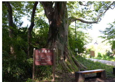
Fig. 7. 천안시 보호수인 광덕사 느티나무