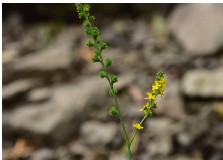
Fig. 6. 짚신나물