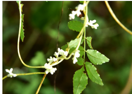
Fig. 5. 실새삼