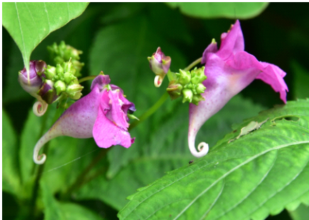
Fig. 4. 물봉선