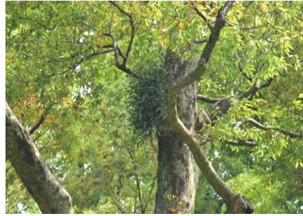
Fig. 3. 겨우살이